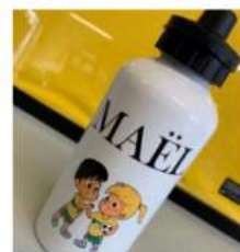
GOURDE-EDF Gourde métal Personnalisée

Le but : Réduire le gaspillage d'eau, la perte de temps entre chaque atelier, ainsi que de montrer l'importance de s'hydrater sans se contaminer.